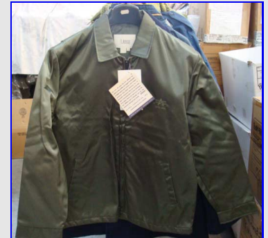
AE/96 MP Tex Made in USA